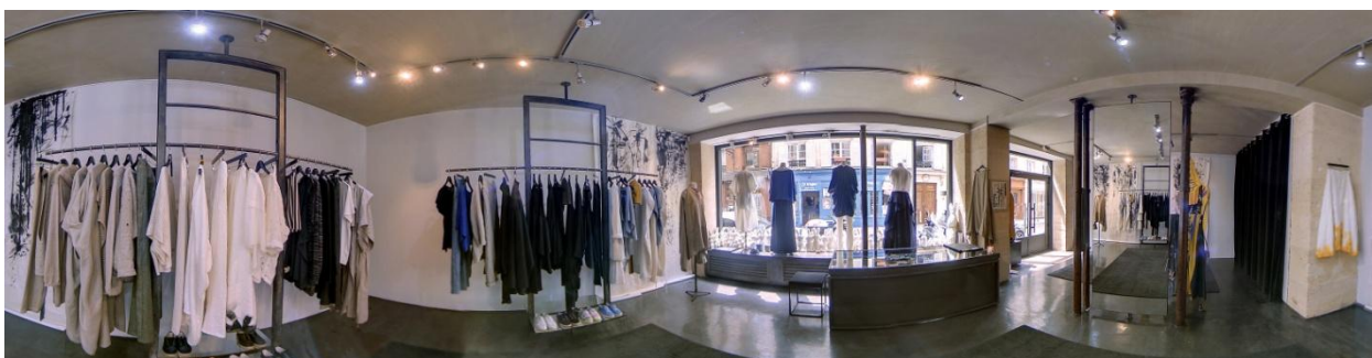
Exemple de visite virtuelle – Magasin Irakli, Paris 1 er