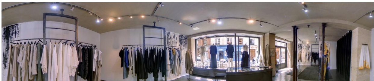
Exemple de visite virtuelle - Magasin Irakli, Paris 1 er